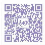
禅医官方微信号 Official Wechat